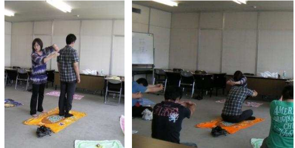
保健師ワークショップの様子