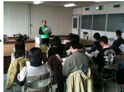
職業訓練説明会の様子