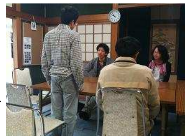
社会人体験合宿での様子

※参加費用 10,800 円（施設使用料、食費） 現地までの交通費は各自ご負担下さい